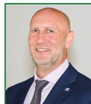
Senior Management Team 학교 운영진